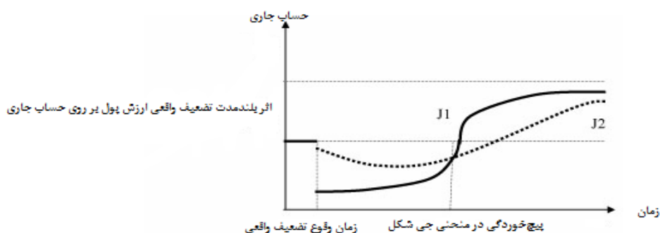
نمودار ۱. اثر بلند مدت تضعیف واقعی ارزش پول بر روی حساب جاری مأخذ: (پیلیم، ۱۹۹۱)

ارز به قیمت‌های داخلی واردات طول بکشد، بدتر شدن اولیه وضعیت تراز تجاری یک دفعه رخ نمی‌دهد بلکه به صورت تدریجی رخ می‌دهد که با نماد 2 در نمودار (۱) نشان داده شده است.