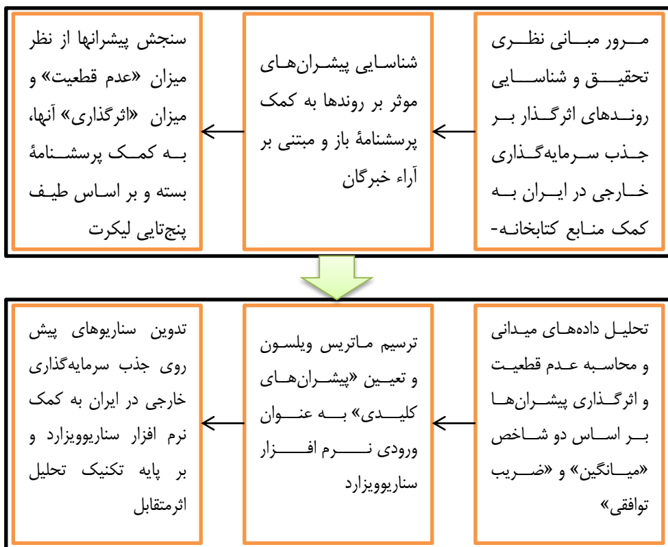
شکل ۱. فرایند کلی تحقیق