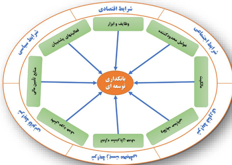
شکل ۲. الگوی پژوهشی مؤلفه‌های مؤثر بر بانکداری توسعه‌ای براساس تحلیل فراترکیب