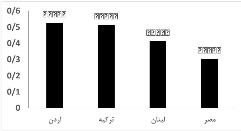
شکل ۲. میانگین تاب‌آوری اقتصادی کشورهای غیرنفتی در بازه زمانی ۲۰۲۰-۲۰۰۰ (مأخذ: یافته‌های پژوهش)

آماره‌های توصیفی متغیرهای مورد مطالعه در جدول (۳) ارائه شده است. در اینجا، مقادیر حداقل، میانگین و حداکثر متغیرها برای هر دو گروه کشورهای نفتی و غیرنفتی قابل مشاهده است. بر این اساس، میانگین تاب‌آوری اقتصادی محاسبه شده برای کشورهای نفتی از کشورهای غیرنفتی بیشتر است. همین موضوع برای متغیرهای ارزش افزوده بخش کشاورزی، صنعت و خدمات نیز صادق است. با این حال، میانگین درجه باز بودن اقتصاد و میانگین درجه شهرنشینی برای کشورهای غیرنفتی از کشورهای نفتی بیشتر است.