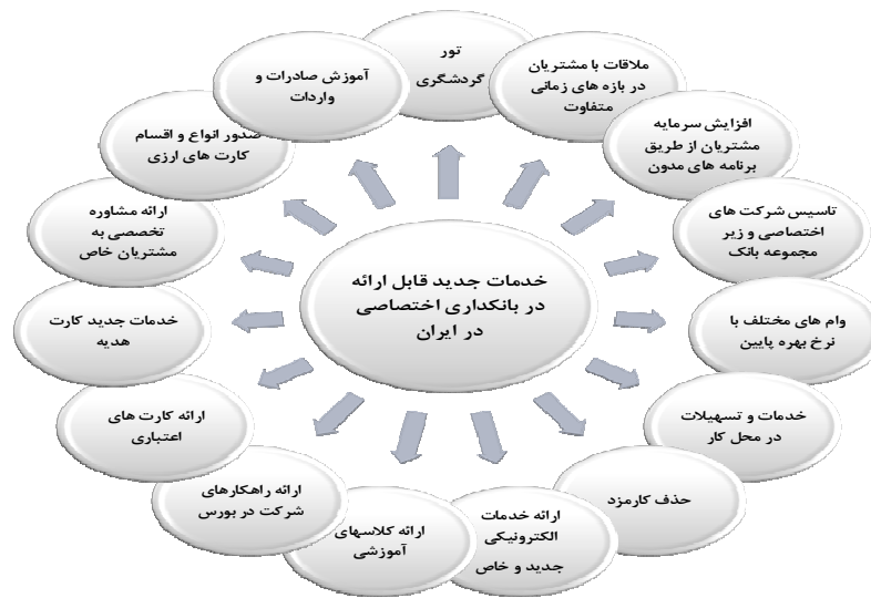
نمودار ۲. خدمات جدید قابل ارائه در بانکداری اختصاصی در ایران

برای پاسخ به آخرین پرسش مطرح شده در این پژوهش که به نوعی با امکان‌سنجی توسعه خدمات بانکداری اختصاصی در کشور مطرح شده است محققین بر آن بودند تا خدمات بالقوه جدیدی را شناسایی نمایند که می‌توان در بانک‌های ایرانی و در قالب طرح بانکداری اختصاصی مطرح نمود، بنابراین در پاسخ به این پرسش موارد مناسبی مطرح شد که برخی از آنها از منظر ادبیات بانکداری اختصاصی جدید بوده و می‌تواند نقطه عطفی در راه توسعه این حوزه باشد. فهرست این خدمات در قالب نمودار (۲) به تصویر کشیده شده است.